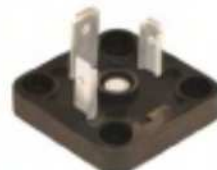
BG4 MODEL MODELLO BG4