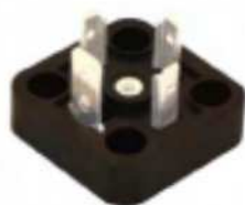
BG1 MODEL MODELLO BG1