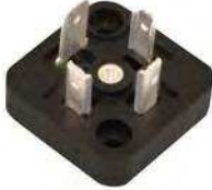
BG2 MODEL MODELLO BG2