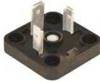
BG4 MODEL MODELLO BG4