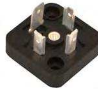
BG5 MODEL MODELLO BG5