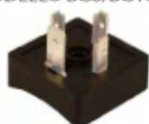
BG8/BG10/BG16 MODEL MODELLO BG8/BG10/BG16