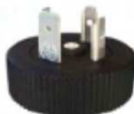
BGR MODEL MODELLO BGR