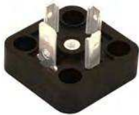
BG1 MODEL MODELLO BG1