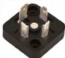
BG5 MODEL MODELLO BG5