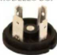
BG7 MODEL MODELLO BG7